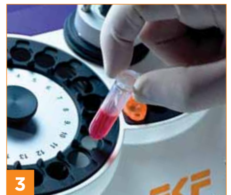
3 Ergebnisse werden innerhalb von 20 - 45 Sekunden angezeigt.