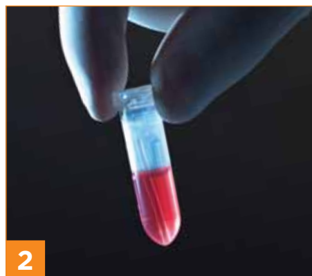
2 Kapillarröhrchen in das Reaktionsgefäß legen und durchmischen.