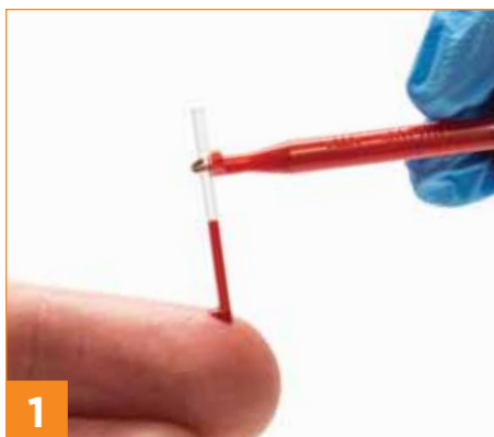
1 Eine 20 µl Blutprobe in das Kapillarröhrchen aufnehmen.