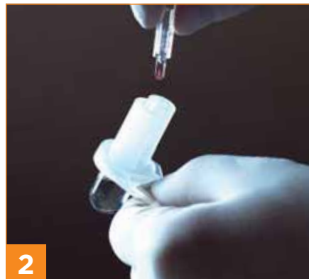
2 Blutkollektor in die Quo-Test Kartusche einfügen.