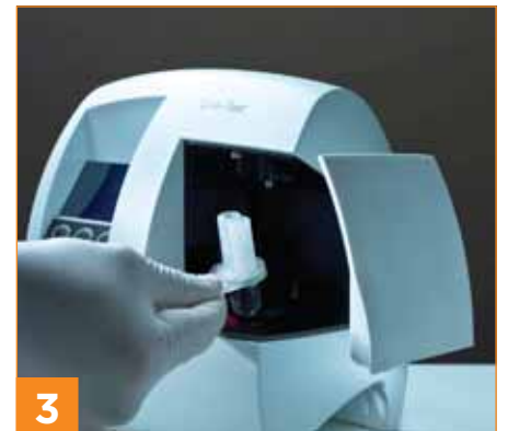
3 Kartusche im Analyzer platzieren. Anzeige des Messwertes innerhalb von 4 min.