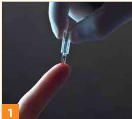
1 4 µL der Blutprobe mit dem Blutkollektor aufnehmen.